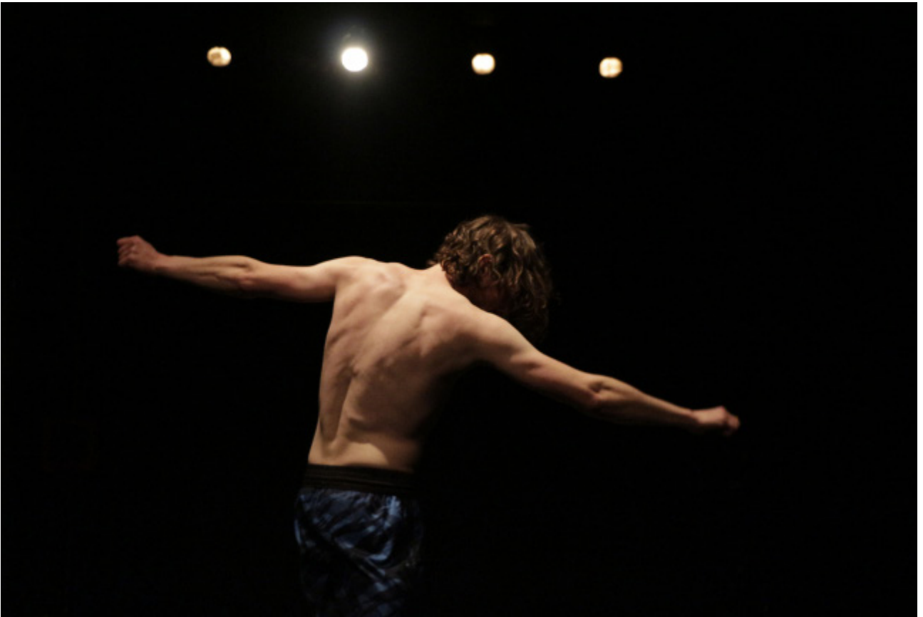
© Zoé Bennet - avec Guillaume Clouet Semaine 1, le Volapük